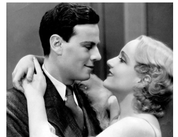
1931 UP POPS THE DEVIL d'A. Edward Sutherland avec Norman Foster