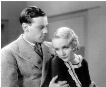
1930 LA PUBLICITÉ RAPPORTE (It pays to advertise) de Frank Tuttle avec Norman Foster