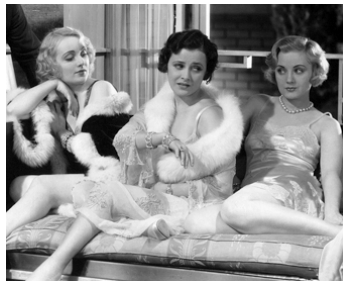
1930 SAFETY IN NUMBERS de Victor Schertzinger avec Kathryn Crawford, Josephine Dunn