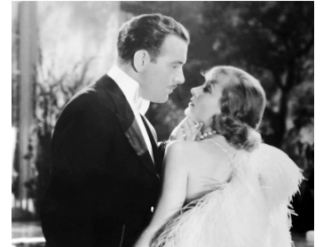
1936 CE QUE FEMME VEUT (Love before breakfast) de Walter Lang avec Preston Foster