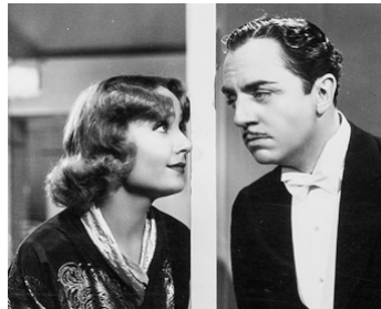
1936 MON HOMME GODFREY (My Man Godfrey) de Gregory La Cava avec William Powell