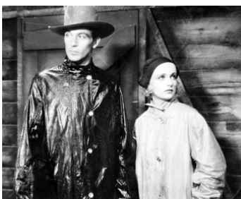
1931 I TAKE THIS WOMAN de Marion Gering avec Gary Cooper