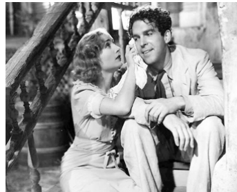
1937 TROMPETTE BLUES (Swing high, swing low) de Mitchell Leisen avec Fred MacMurray