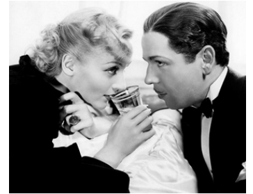
1934 LA DANSEUSE À L'ÉVENTAIL (Lady by Choice) de David Burton avec Roger Pryor