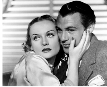
1934 C'EST POUR TOUJOURS (Now and Forever) d'Henry Hathaway avec Gary Cooper