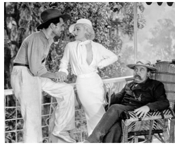
1933 LE FOU DES ÎLES (White Woman) de Stuart Walker avec Kent Taylor, Charles Laughton