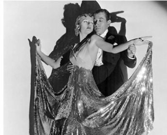
1935 LA DERNIÈRE RUMBA (Rumba) de Marion Gering avec George Raft