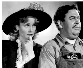
1940 DRÔLES DE MARIAGE (They knew what they wanted) de Garson Kanin avec Charles Laughton