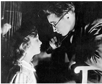
1921 LE CRIME PARFAIT (A Perfect Crime) d'Allan Dwan avec Monte Blue