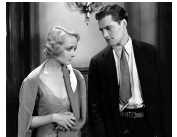
1930 FAST AND LOOSE de Fred Newmeyer avec Charles Starrett