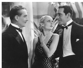
1931 PAS UN SEUL HOMME (No one Man) de Lloyd Corrigan avec Paul Lukas, Ricardo Cortez