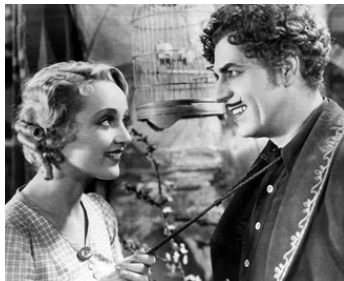
1930 LE TIGRE DE L'ARIZONA (The Arizona Kid) d'Alfred Santell avec Warner Baxter