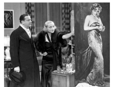
1933 SUPERNATUREL (Supernatural) de Victor Halperin avec Alan Dinehart