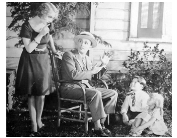
1928 LA CAVE SANGLANTE (Ned McCobb's Daughter) de W. Cowen avec George Barrard