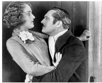
1925 LA MERVEILLEUSE AVENTURE (Marriage in Transit) de Roy W. Neill avec Edmund Love