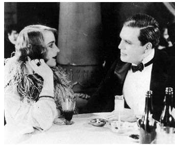
1925 L'OMBRE QUI DESCEND (The Road to Glory) d'Howard Hawks avec Leslie Fenton