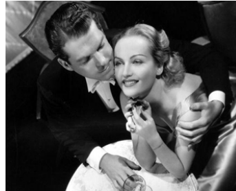
1935 JEUX DE MAINS (Hands across the Table) de Mitchell Leisen avec Fred MacMurray