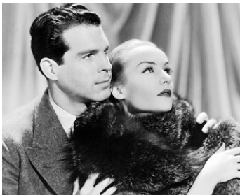
1936 UNE PRINCESSE EST À BORD (The Princess comes across) de W. Howard avec F. MacMurray