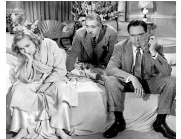
1937 LA JOYEUSE SUICIDÉE (Nothing Sacred) de W. Wellman avec Ch. Winninger, F. March