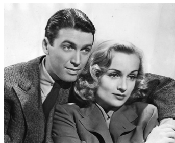
1939 LE LIEN SACRÉ (Made for each other) de John Cromwell avec James Stewart