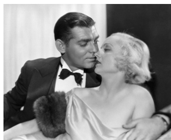
1932 UN MAUVAIS GARÇON (No Man of her Own) de Wesley Ruggles avec Clark Gable