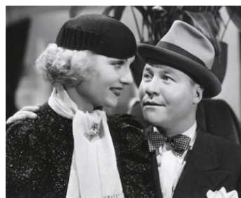
1932 VIES CROISÉES (From Hell to Heaven) d'Erle C. Kenton avec Sidney Blackmer