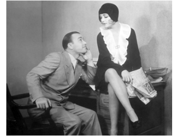
1929 BONNES NOUVELLES (Big News) de Gregory La Cava avec Robert Armstrong