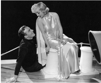
1934 WE'RE NOT DRESSING de Norman Taurog avec Bing Crosby