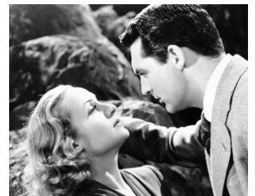
1939 L'AUTRE (In Name Only) de John Cromwell avec Cary Grant