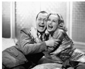
1940 JOIES MATRIMONIALES (Mr and Mrs Smith) d'Alfred Hitchcock avec Robert Montgomery