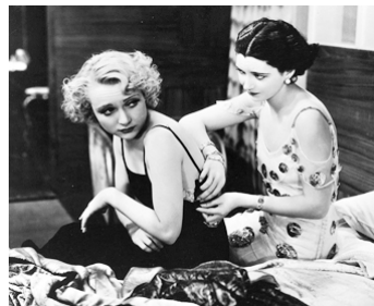
1931 MONSIEUR DES DAMES (Ladies' Man) de Lothar Mendes avec Kay Francis