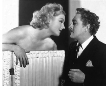
1934 TRAIN DE LUXE (Twentieth Century) d'Howard Hawks avec John Barrymore