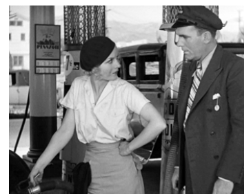
1932 VERTU (Vertue) d'Edward Buzzell avec Pat O'Brien