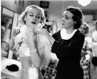
1934 LA JOYEUSE FIANCÉE (The gay Bride) de Jack Conway avec Zasu Pitts