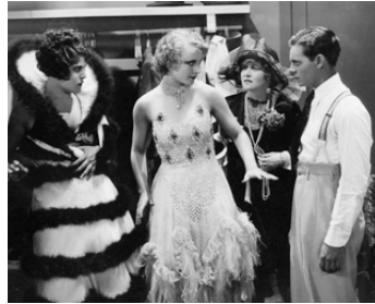
1928 BATACLAN (Show Folks) de Paul L. Stein avec Lina Basquette, Eddie Quillan