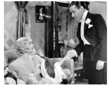
1933 BOLÉRO (Bolero) de Wesley Ruggles avec George Raft