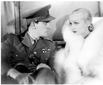
1933 L'AIGLE ET LE VAUTOUR (The Eagle and the Hawk) de Stuart Walker avec Fredric March