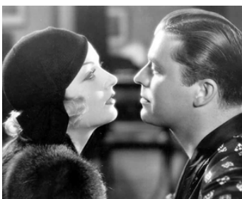
1932 ÉCHEC AU PRINCE (No more Orchids) de Walter Lang avec Lyle Talbot