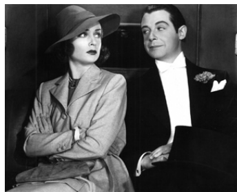
1938 LA PEUR DU SCANDALE (Fools for Scandal) de Mervyn LeRoy avec Fernand Gravy