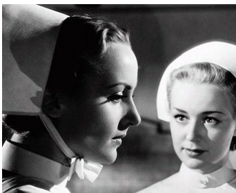
1940 VEILLEUSE DE NUIT (Vigil in the Night) de George Stevens avec Anne Shirley