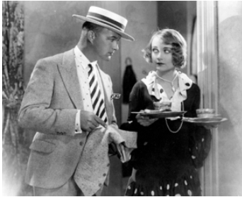
1928 LE SEXE FORT (Power) d'Howard Higgin avec William Boyd